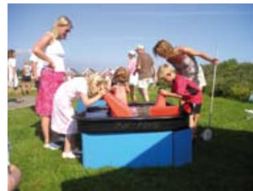
Kom helt tæt på livet i havet.

Blå Flag-arrangementer sætter fokus på havet og de mange dyr og planter, som lever der. For børnefamilier især er det en chance for at få en spændende og lærerig oplevelse sammen. På Rønnerhavnen i Frederikshavn vil man bl.a. kunne få en sejltur med fiskerne og prøve en lang række aktiviteter, bl.a. krabbefiskeri og levende fisk i bassiner.