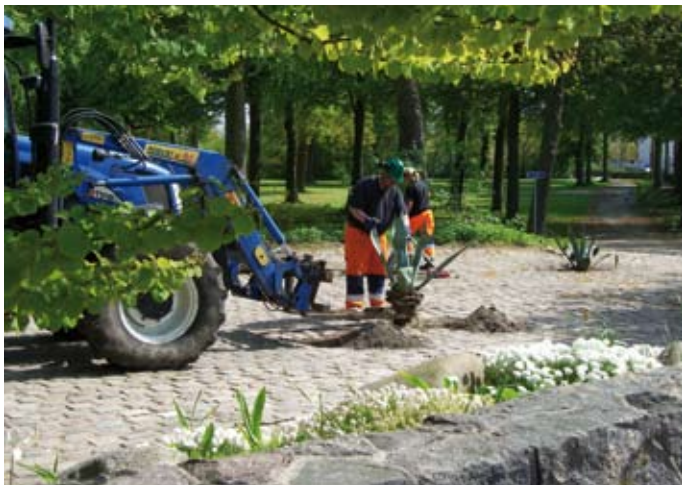
Park &amp; Vejforsyningen planter agaver i Plantagen.