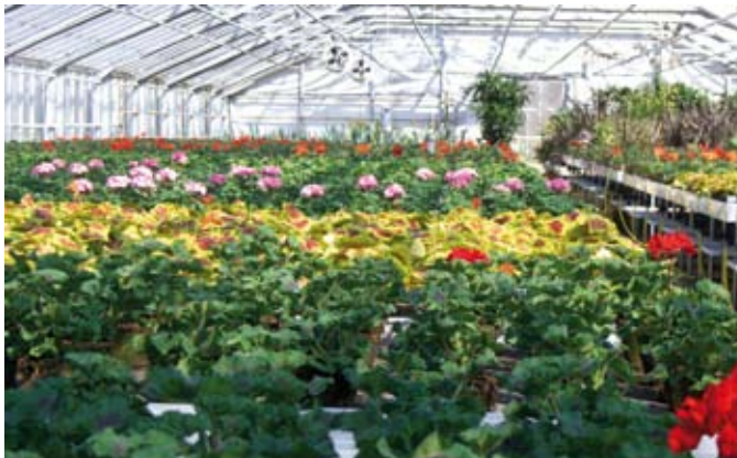
Gartneriet byder indenfor til lærvrige oplevelser.

På dagen vil der være rig lejlighed til at se faciliteterne. Tag en snak med medarbejderne om alle de grønne glæder, og få dig en hyggelig og ikke mindst lærerig oplevelse.