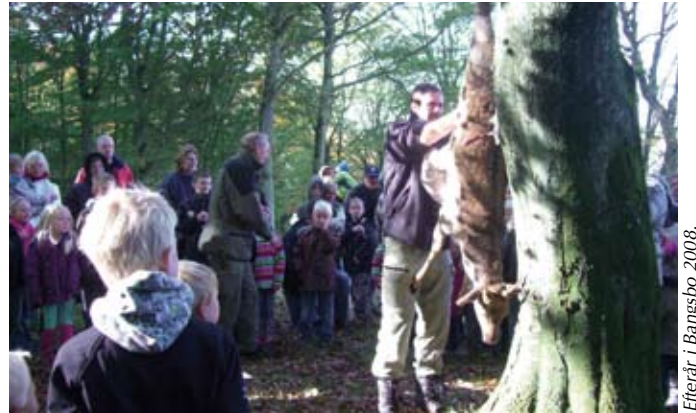
Efterår i Bangsbo 2008.