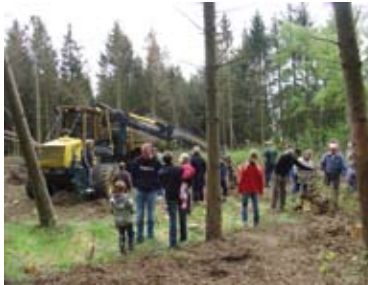
Skovens Dag 2007

www.forsyningen.dk , www.frederikshavn.dk og i dagspressen.