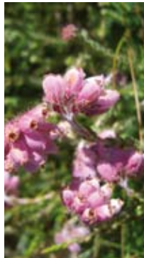
Fredløs, Djævelsbid og Klokkelyng