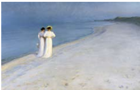
Sommeraften på Skagen Sønderstrand. 1893 Tilhører Skagens Museum