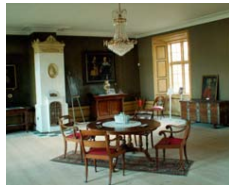
Sommerstuen på herregården Sæbygaard ved Sæby

Museerne har også en helt særlig rolle som formidler af kultur- og naturarven, og dermed at synliggøre den kulturhistorie, som vi alle er en del af. Museer i