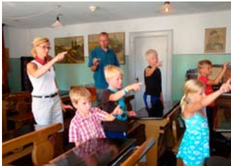
Undervisning i den gamle skolestue, Sæby Museum

"Skal museerne også i fremtiden indtage en central plads i samfundet, er det derfor afgørende, at de styrker deres position som åbne og tilgængelige kulturinstitutioner, der arbejder professionelt med formidling og kommunikation"