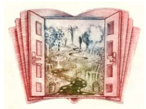
Håndkoloreret radering udført af Michaela Lesarova