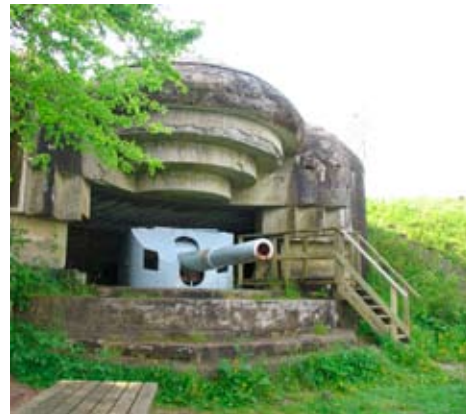
En af artilleriskibet Niels Juels kanoner på Bangsbo Fort, som er en del af Bangsbo Museum

Skagens Museum er med i IKON, som er et Interreg IVA-projekt under Den Europæiske Regionale Udviklingsfond. IKON-projektet består af 48 partnere fra Norge, Sverige og Danmark. IKON står for: Interregionalt Kultur Oplevelses Netværk