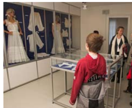
Gæster på besøg i tekstiludstillingen i hovedbygningen på Bangsbo Museum

"Jeg vil hellere vente til Skagens Museum kommer på DVD" citat af 11-årig dreng om et kommende besøg på Skagens Museum