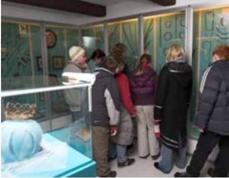
Skoleelever på besøg i den store hårsmykesamling på Bangsbo Museum