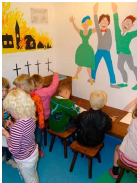
For de helt små børn er der på Bangsbo Fort indrettet en børnebunker, der på børnenes præmisser fortæller om besættelsen og 2. verdenskrig

Projektidé: Aftalte bortførelser af børn fra 6. – 9. klasse på folkeskolerne i hele kommunen. Børnene oplever adskillelse, intimidering og overvågning i form af tyske soldater på skolerne. Iscenesat bortførelse til Bangsbofortet på 9. april, 4. Maj eller 28. august. Samarbejde mellem museer, folkeskoler, foreninger og nøglepersoner.