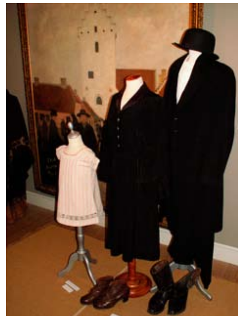
Lokalhistorie og Sæbykunst

Når genstande og værker indgår i museernes samlinger, skal de registreres. Registreringen omfatter ud over en beskrivelse af genstanden også de oplysninger, der knytter sig til genstanden – dens proveniens. Registreringen indberettes til "Museernes Samlinger" (Regin), som er en registreringsdatabase kun for museerne.