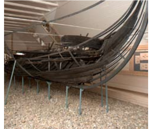
Ellingåskibet er fra ca. 1163 og står i Ellingåskibshallen på Bangsbo Museum