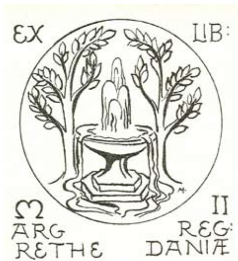
Exlibris udført af Dronning Margrethe

Museumspolitikken skal ansoppe museerne til at påtage sig rollen som demokra-