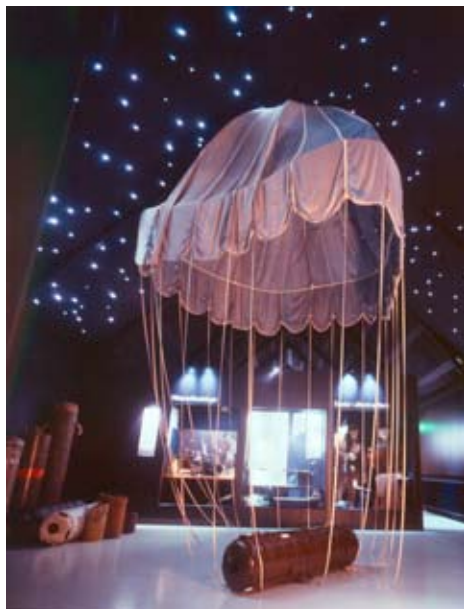
Nedkastningsscene med container og faldskærm på Det Jyske Modstandsmuseum på Bangsbo Museum. Museet er specialmuseum for besættelsen i Jylland

Man kan blive viet på Nordjyllands Kystmuseum, Skagen Museum og Frederikshavn Kunstmuseum?