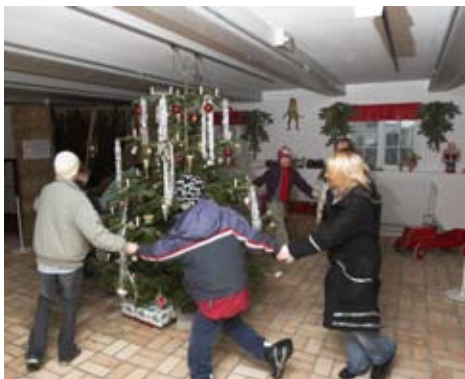
Skolebørn danser om juletræet i den traditionrige juleudstilling i riddersalen på Bangsbo Museum.