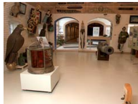
Bangsbo Museum er specialmuseum for søfart og handel i region Nordjylland. Dette billede viser en lille del af søfartsudstillingen