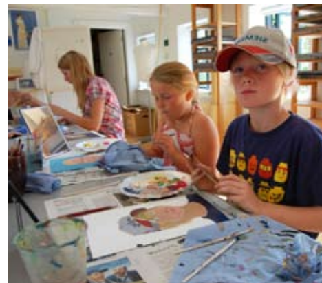
Malerskolen på Skagens Museum