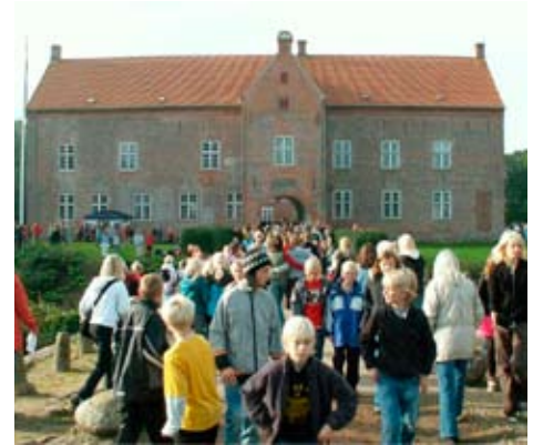
En flok skolebørn foran indgangen til herregården Sæbygaard ved Sæby

Borgerne skal ikke bare forbruge kulturydelser – de skal være med til at skabe og tilrettelægge dem.