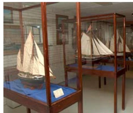
Et lille udsnit af skibsmodeller som står i søfartsudstillingen på Bangsbo Museum