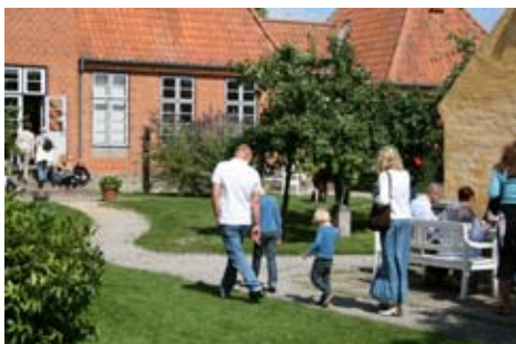
Skagens Museums have