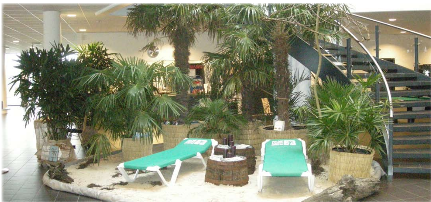
Gartneriets palmer skaber atmosfære ved et arrangement i Arena Nord.