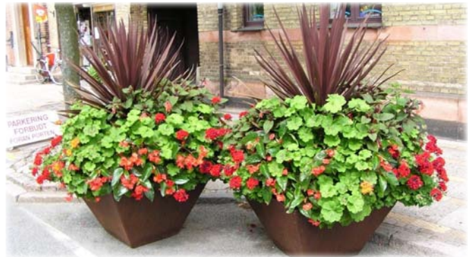
Planten i midten af krukken hedder Cordilyne australis 'Red Star'.

Her udplantes blomsterne og de mange krukker og kummer bliver stillet op rundt om i kommunen. De bliver grupperet efter design for at gadebilledet fremstår harmonisk og varieret i hele kommunen.