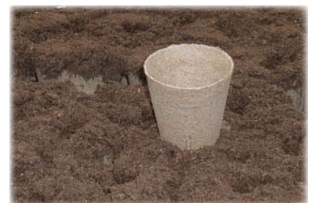
Jiffy-potter er lavet af sphagnum, som omsættes til muld.

Der bruges flere forskellige størrelser potter alt efter hvilke planter, der er tale om. Det er umuligt at sige, hvor mange potter der anvendes, men det løber op i mange tusinde, når der for alvor er gang i pottingen.