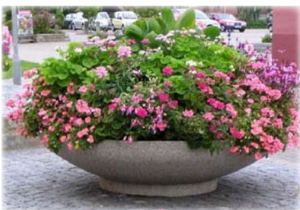
Sammensætningen af blomster ændres fra år til år.

Hvert år udsmykkes Europa-vej/Skagensvej i Frederikshavn med store agaver, hvilket giver både borgere og tilrejsende en flot og imødekommende ople-