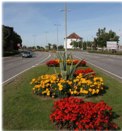
Agaverne danner en flot indgang til Frederikshavn by.

Fra 2008 anvendte vi for første gang "Jiffy-potter", som er organiske og lavet af komprimeret sphagnum. Løsningen er en smule dyrere i indkøb, men sparer til gengæld en del tid og arbejde.