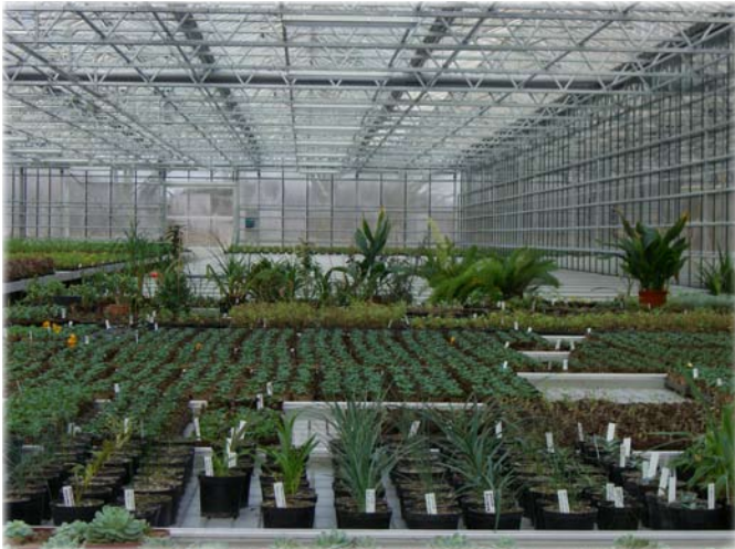
De store drivhuse rummer et væld af forskellige planter.

Der tages ca. 8.000-10.000 stiklinger fra beregnet til udplantning året efter. Desuden begynder arbejdet for alvor med at potte omkring 15.000 hjemkøbte småplanter. Der udsættes også et antal forårskummer, ca. 40 stykker, og bedene plantes til med forårsløg.