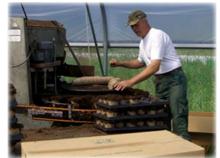
En af gartneriets egne folk i færd med at 'potte'.

ces i forhold til håndpotning, som blev brugt for bare seks år siden.