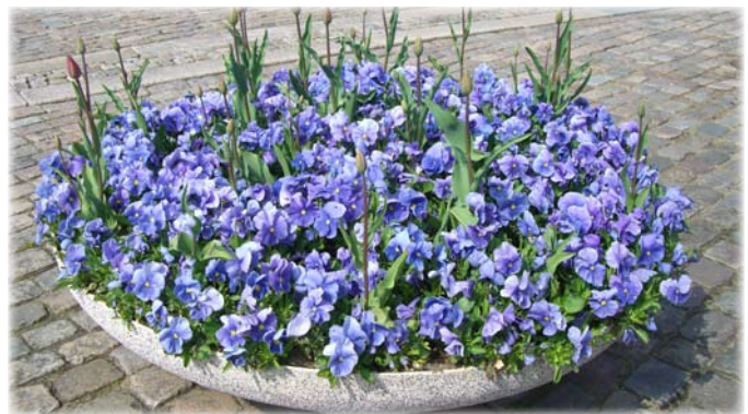
Forårskumme med løg og stedmoderplanter.

Kummer og krukker køres tilbage til gartneriet i uge 40-41, og bedene bliver gjort vinterklare. Hermed er blomsterhøjsæsonen slut.