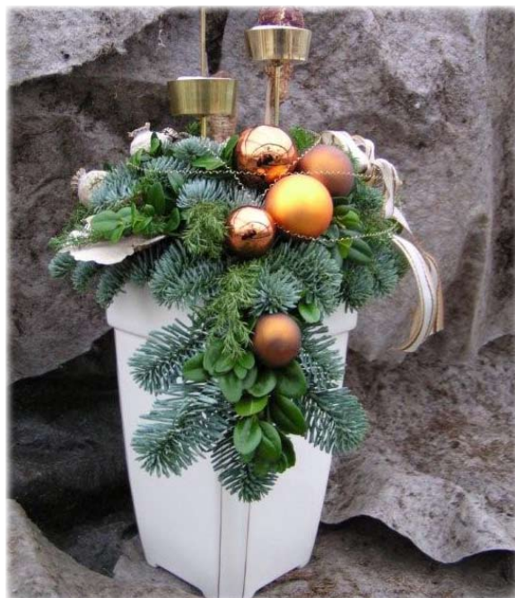
En af Gartneriets flotte juledekorationer.