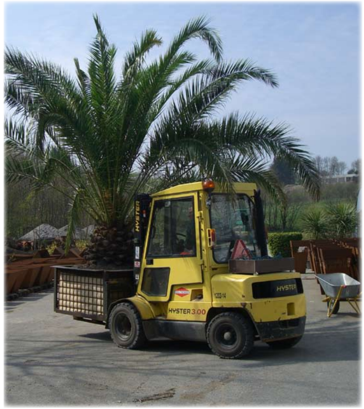
De tunge palmer bliver flyttet med truck.