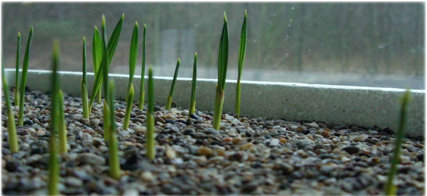
De små spirer her er fremtidens palmer, som er hjembragt fra Mallorca af en af Gartneriets medarbejdere i efteråret 2007. De er plantet i grus for at give de bedste vækstbetingelser.

Park & Vej Knivholtvej 15 9990 Frederikshavn Tlf: 9845 6000