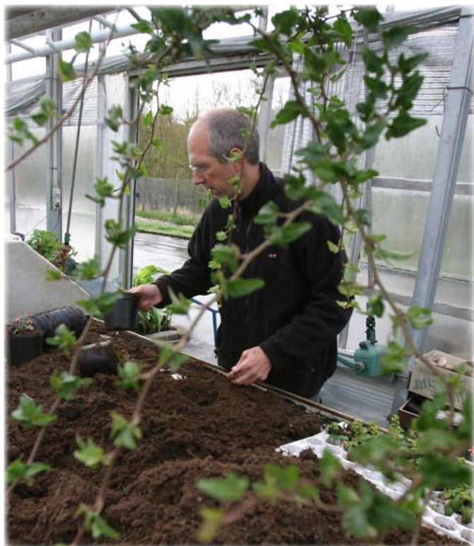
En gartner i formeringshuset.

Park & Vej Knivholtvej 15 9990 Frederikshavn Tlf: 9845 6000