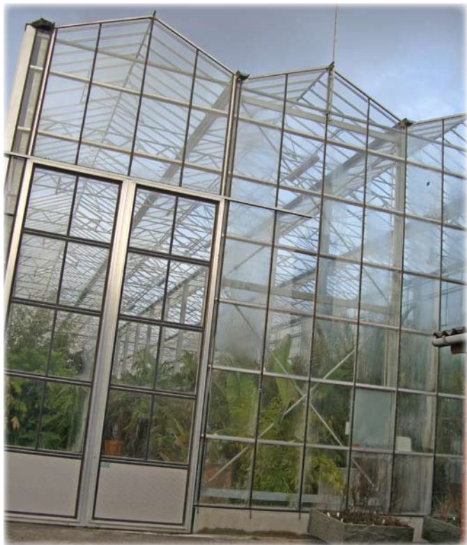
Det store palmehus fra 2006.

Gartneriet har en lang historie bag sig og har været placeret flere steder i Frederikshavn by. Omkring midten af 70'erne flyttede det til dets nuværende placering på Brønderslevvej 20. Seneste udvidelse fandt sted i 2006, hvor palmehuset blev indviet.