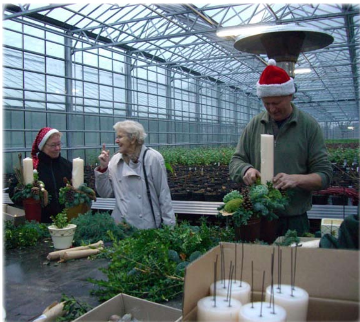
I Gartneriet fremstilles der også juledekorationer til kommunale bygninger og institutioner.