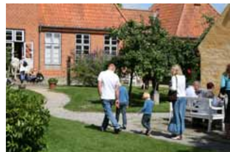
Skagens Museums have