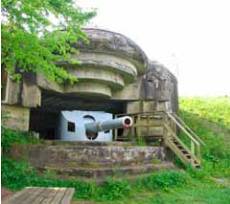
En af artilleriskibet Niels Juels kanoner på Bangsbo Fort, som er en del af Bangsbo Museum