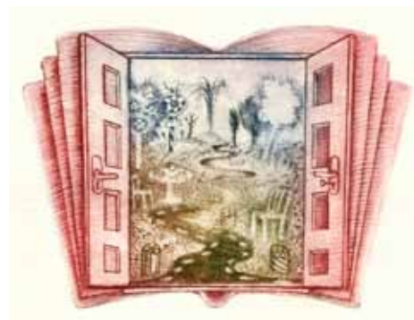
Håndkoloreret radering udført af Michaela Lesarova