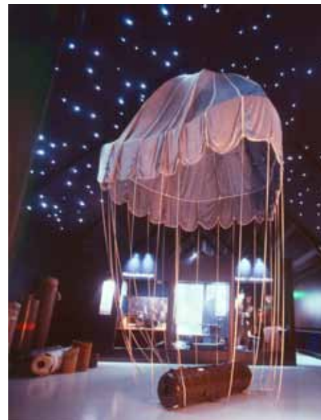
Nedkastningsscene med container og faldskærm på Det Jyske Modstandsmuseum på Bangsbo Museum. Museet er specialmuseum for besættelsen i Jylland