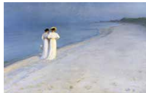
Sommeraften på Skagen Sønderstrand. 1893 Tilhører Skagens Museum

Netværket kan give museerne stor viden og impulser om fremtidens udstillingsformer, etablering af læringsnetværk, digitale formidlingsformer og direkte dialog med brugerne.