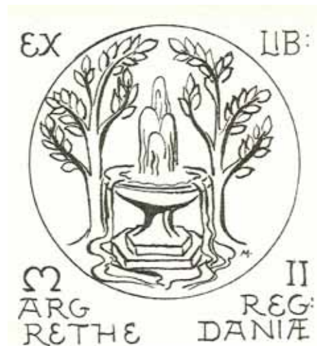
Exlibris udført af Dronning Margrethe

Museerne har en enestående mulighed for at udnytte det oplevelsespotentiale de rummer ved at gøre lokalrådets historie og kulturarv aktiv og levende ved at inddrage borgerne som medaktører.