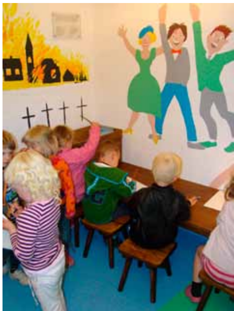
For de helt små børn er der på Bangsbo Fort indrettet en børnebunker, der på børnenes præmisser fortæller om besættelsen og 2. verdenskrig

Udviklingen søges fremmet i et frugtbart samspil med en lang række aktører i ind- og udland, jævnfør resultatkontrakterne med de enkelte museer samt museernes individuelle udviklingsplaner.