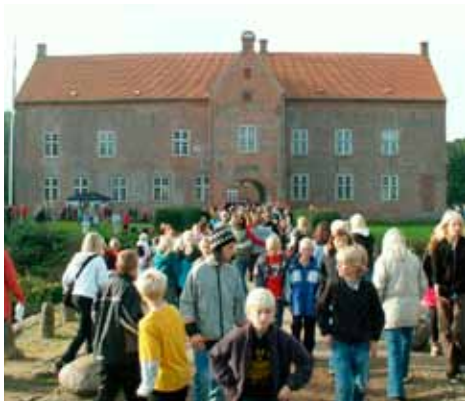
En flok skolebørn foran indgangen til herregården Sæbygaard ved Sæby

På den måde kan kommunen bringe historie og kulturarv i spil på helt nye måder og borgerne og besøgende bliver ikke bare forbrugere af kulturydelser – de bliver medskabere og medtilrettelægger af oplevelserne.