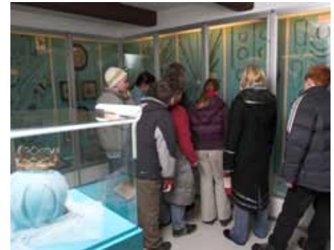
Skoleelever på besøg i den store hårsmykke-samling på Bangsbo Museum