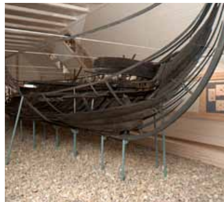
Ellingåskibet er fra ca. 1163 og står i Ellingåskibshallen på Bangsbo Museum