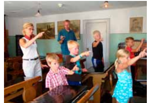
Undervisning i den gamle skolestue, Sæby Museum

Politikken skal udmøntes i resultatkontrakter med de enkelte museer for perioden 2011-2014, og kontrakterne skal således være det redskab, der omsætter politikken til konkrete handlinger, og skaber synlighed omkring museernes aktiviteter, samarbejder og partnerskaber.