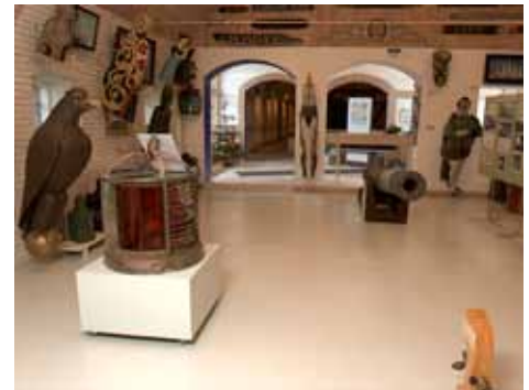
Bangsbo Museum er specialmuseum for søfart og handel i region Nordjylland. Dette billede viser en lille del af søfartsudstillingen

Museer i Frederikshavn Kommune skal bringe deres viden og kompetencer som iscenesættere, formidlere af identitet, historie og udtryk i spil i nye partnerskaber med andre aktører i kommunen og derved spille en aktiv rolle i udviklingen af lokalsamfundet og tage et socialt medansvar.