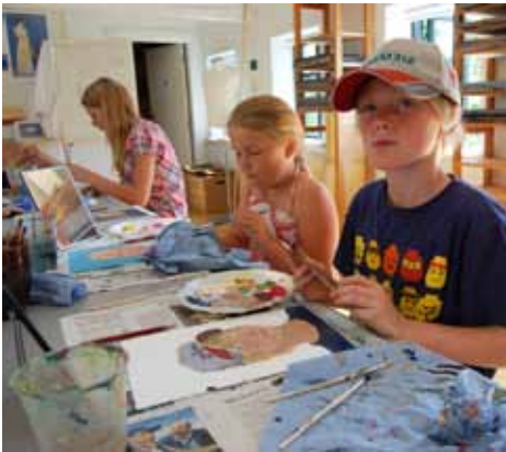
Malerskolen på Skagens Museum

Den gode formidling foregår ikke kun ét sted. Der ligger en vigtig opgave for museerne i forhold til at kombinere en aktiv formidlingsindsats inden for murene med decentrale formidlingspunkter uden for murene via eksempelvis virtuel kommunikation.