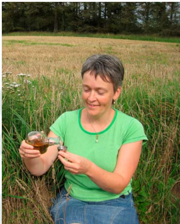
Bjesk er et hyggeligt indslag på en tur i det grønne.

Sidst, men ikke mindst, er det at lave sin egen bjesk jo også forbundet med en masse hyggelige timer, både før, under og efter fremstillingen. Når der skal smages eller serveres til en god frokost, eller en aften, hvor vinden huler om hushjørnerne eller regnen slår på ruden, så kan du finde din bjeskflaske frem og lade tankerne gå tilbage, til da du gik og ledte efter planterne.