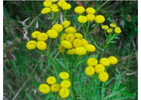
Rejnfan - tag blade i maj/juni - blomster i august/september

Du er altid velkommen til at ringe eller skrive til mig, hvis du har nogle spørgsmål. Telefonnummer og e-mailadresse finder du på bagsiden af denne folder.