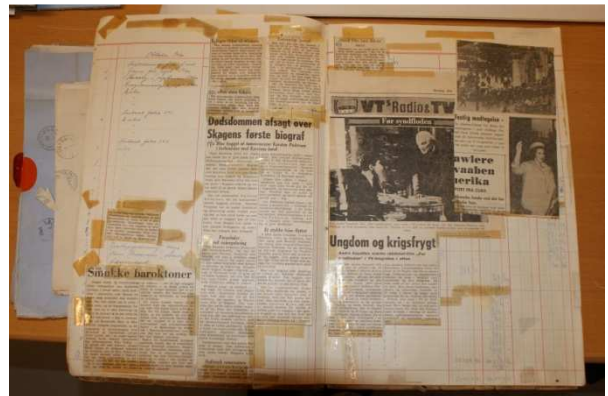
3. DEN OMTALTE SCRAPBOG. SOM DET ANES, HAR DEN GULNEDE OG NU VIRKNINGSLØSE TAPE SAT SINE TYDELIGE SPOR I ARKIVMATERIALET.

Arkivmaterialet består fortrinsvis af regnskabsbøger som fx programhovedbøger, indtægtshovedbøger, lister over billetsalget, kassejournaler, lønningsregnskaber og endelig en scrapbog, der at dømme efter udklippenes alder er fremstillet i perioden 1962-1972. Scrapbogens indhold dækker et bredt spektrum af emner, der alle på en eller anden måde relaterer til biografvirksomheden. Der er filmmtaler, kritik af TVets indtog i de danske stuer, interview med forskellige biografmænd og filmproducenter, filmforevisninger samt debatten om biografens svigtende økonomi sidst i 1960erne.