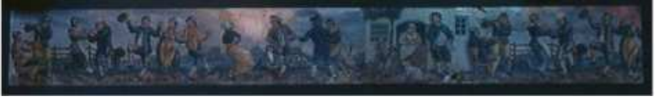
1. BRUDSTYKKE AF DEN RENÆSSANCEINSPIREDE FRISEUDSMYKNING I SKAGEN BIOGRAFTEATER

Frederikshavn Stadsarkivs registrering af arkivmateriale fra den gamle biograf: "BIO" i Skagen har givet anledning til følgende lille artikel.