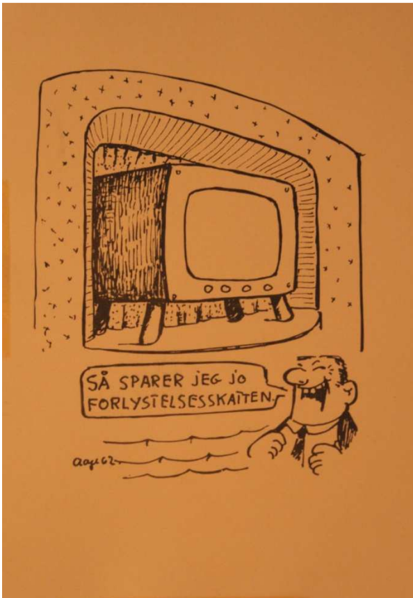
5. "HJEMMEBIOGRAFEN" PÅ PLADS. EN SATIRISK HENTYDNING TIL KONKURRENCEN FRA TV'ET

Nedenfor ses en affotografering af en satirisk tegning fra scrapbogen, hvis budskab følger bogens røde tråd jf. kritikken af fjernsynskikkeriets omfang.