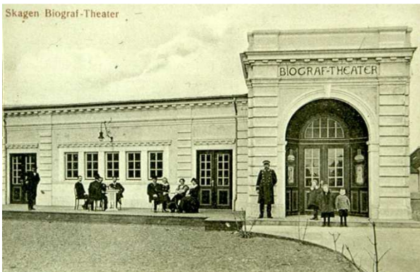
4. INDGANGSPARTIET TIL SKAGEN BIOGRAFTEATER.

Tømrmesteren havde i forbindelse med udsmykningen allieret sig med malermester Chresten Pedersen, der i tidens stil dekorerede biografen med frescoer hvis motiver var inspireret af den italienske renæssance.