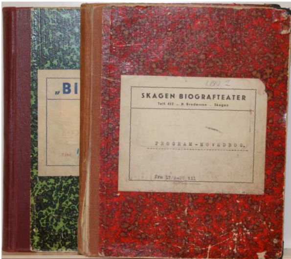
2. EKSEMPEL PÅ ARKIVMATERIALET, HER PROGRAMHOVEDBØGER FRA HENHOLDSVIS SKAGEN BIOGRAFTEATER OG DET SENERE "BIO".

Frederikshavn Stadsarkivs registrering af arkivmateriale fra den gamle biograf: "BIO" i Skagen har givet anledning til følgende lille artikel.