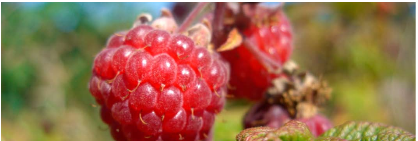
I kommunens skove må der i modsætning til private frit samles blomster og bær. Her er det vilde hindbær i Nielstrup Plantage.

Forslaget er således en lokaltilpasset udmøntning af bl.a. Danmarks Nationale Skovprogram, Handlingsplan for biologisk mangfoldighed og naturbeskyttelse i Danmark samt de danske retningslinjer for bæredygtig skovdrift, der alle danner grundlag for en voksende andel kommuner, Skov og Naturstyrelsen og øvrige offentlige skovejeres drift.