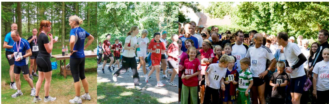
Katsig Løbet og Bangsbo Løbet skaber dynamik i lokallivet.

Skove skaber livskvalitet og udgør et vigtigt potentiale i forhold til at styrke borgernes sundhed. Skovene kan være med til at øge den fysiske aktivitet og dermed forebygge livsstilsrelaterede sygdomme som diabetes, fedme og stress. Tilgængelighed til spændende nærrekreative skove vil kunne tilføre kommunens borgere et sundhedsfremmende element. Vi vil derfor opbygge skove, der byder på fysisk udfordrende fritidsaktiviteter såvel som grønne oaser med mulighed for at opleve fred og ro.