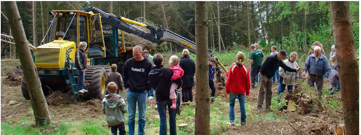
Interessen for f.eks. skovdrift og livet i skoven vokser hele tiden - her ved Skovens Dag 2007.

Et vigtigt kriterium for indfrielse af fremtidige driftsplaners indhold og bæredygtighed er en øget borgerinddragelse. Der vil blive fokuseret på informationsudbredelse, åbenhed og dialog omkring driften af kommunens skove. Frederikshavn Kommunes grønne råd vil være et væsentligt og naturligt forum i denne forbindelse.