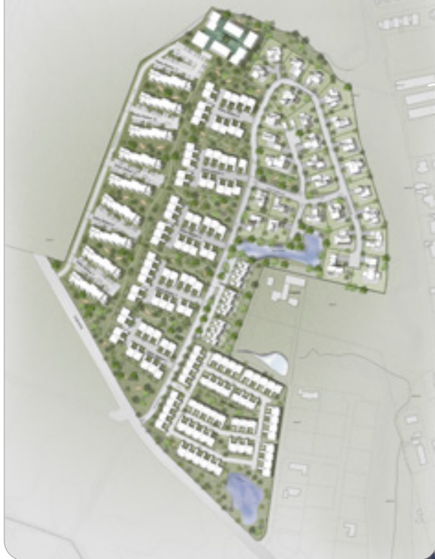
Illustration - Sæby Bakker

Kommuneplantillæg nr. 15.84 Boligområde ved Langtvedvej, oktober 2021. Lokalplan SAE.B.02.15.02 november 2021 for en del af området giver mulighed opførelse af boliger i form af åben-lav-, tæt-lav- og etageboligbebyggelse.